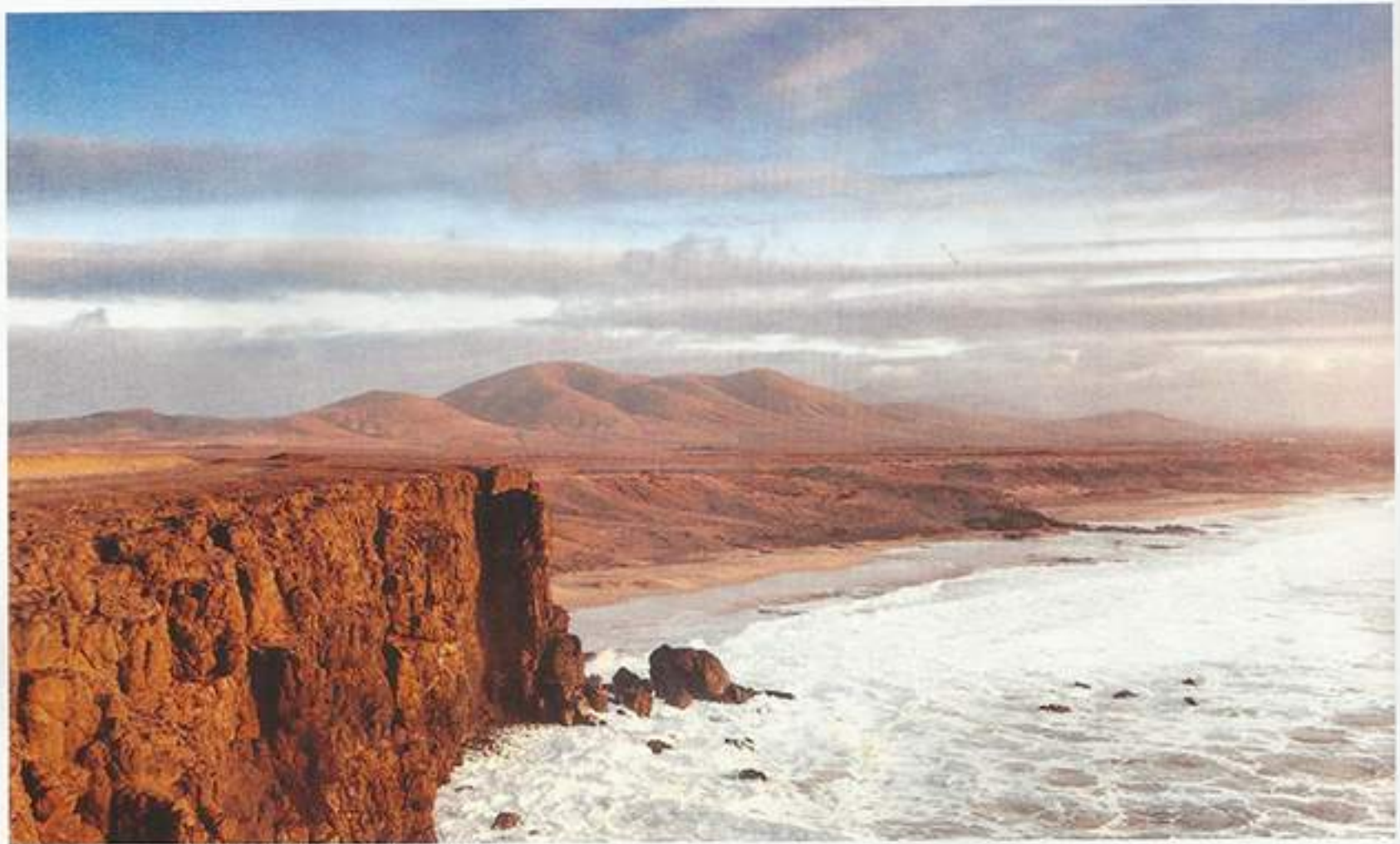
Naturbelassen und ein Geheimtipp: Touristen sieht man selten am Strand von El Cotillo im Norden Fuerteventuras.

Wäldern und Wiesen, einsame Strände – wenn man weiß wo – und dazu das perfekte Klima. Im Sommer ist es nicht zu heiß und im Winter nicht zu kalt und fast immer scheint die Sonne – wer würde hier nicht leben wollen?