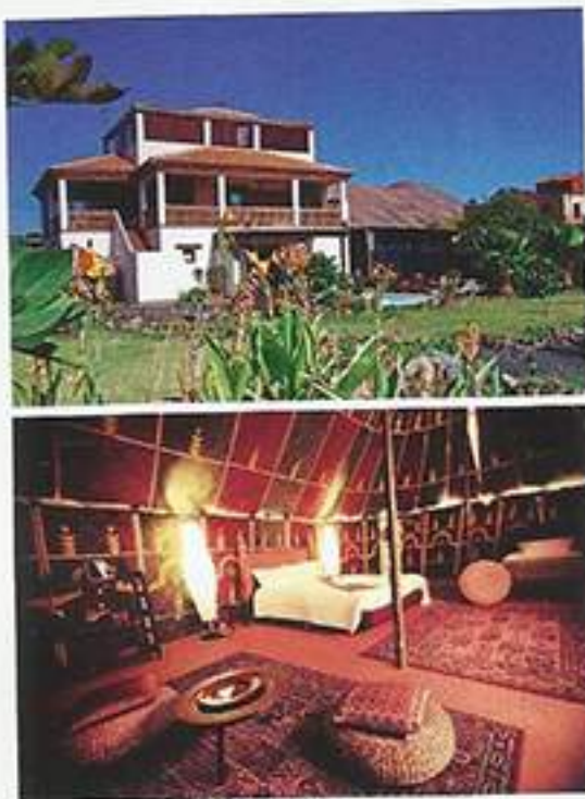
FUERTEVENTURA Malerische Meditationen möglich: Retreat (vom Garten aus) und das exklusive Meditationszelt.