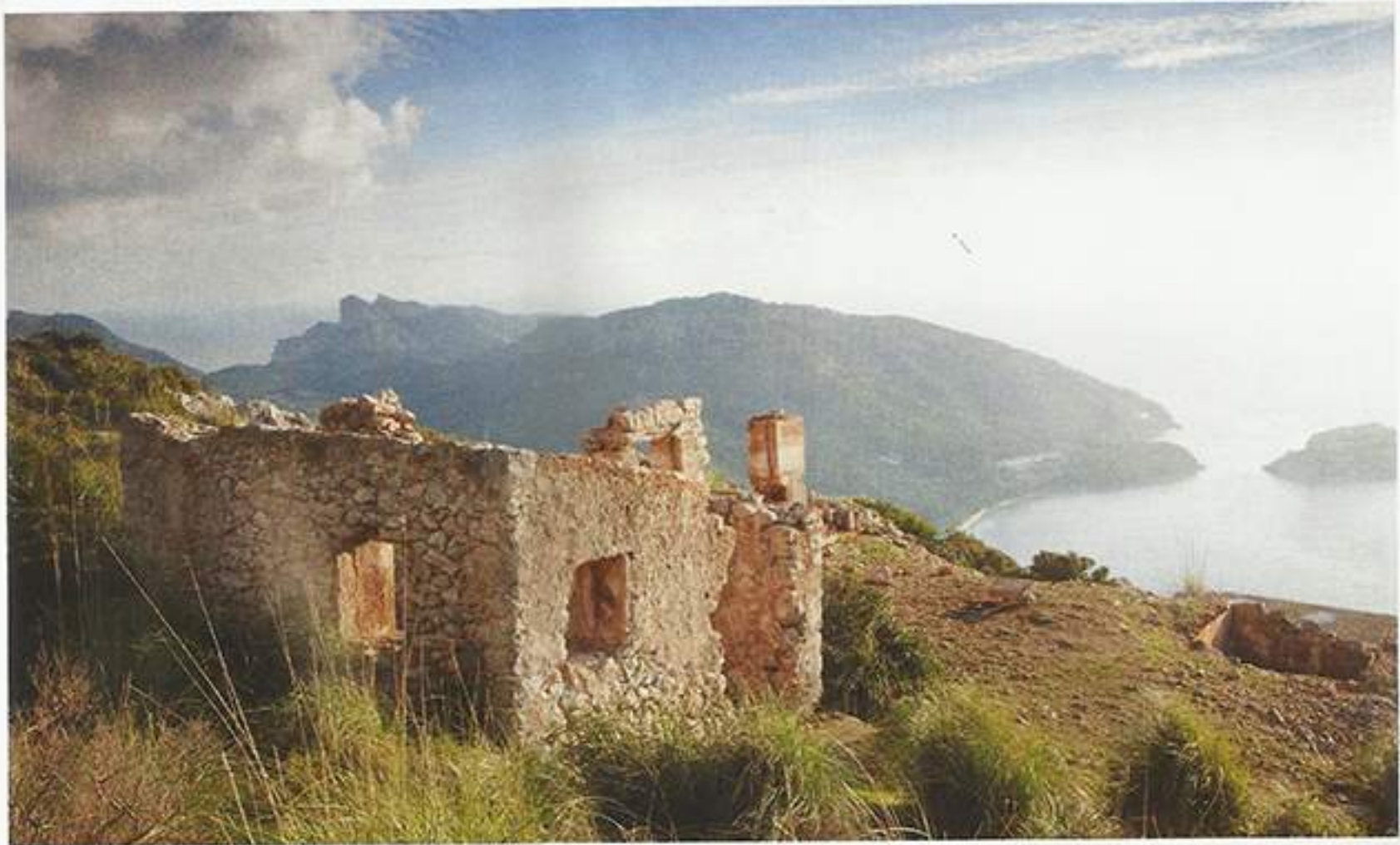
Geheimnisvolle Ruinen wie hier bei Pollenca im Norden Mallorcas künden von vergangenen Zeiten.